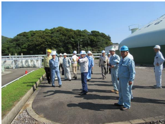
写真3 ハカマカズラが原生する野島を背景とした見学状況

講義・工場見学では、工場内で2トン/日発生する自然気化ガス（BOG）の処理の方法、貯槽タンクの冷却状況や液漏れ等について、サテライト化に伴い不要となるLNG貯水槽の今後の活用などについて、制御システムの保安管理、供給のための配管の構造や供給圧についてなど活発な質疑が交わされました。