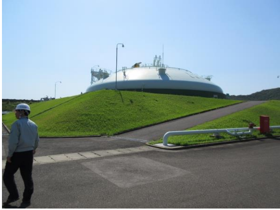
写真2 サテライト化に伴い廃止される3.5kl LNGタンク