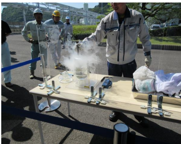
写真1 天然ガスの燃焼実験

また、天然ガスは、ガス中毒の原因となる一酸化炭素を含んでなく、液化の過程で、硫黄分などの不純物も取り除かれており、極めてクリーンで安全なエネルギーです。